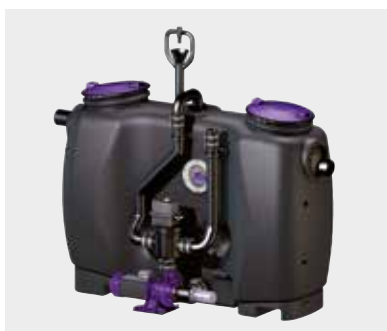
Fettabscheider EasyClean PV