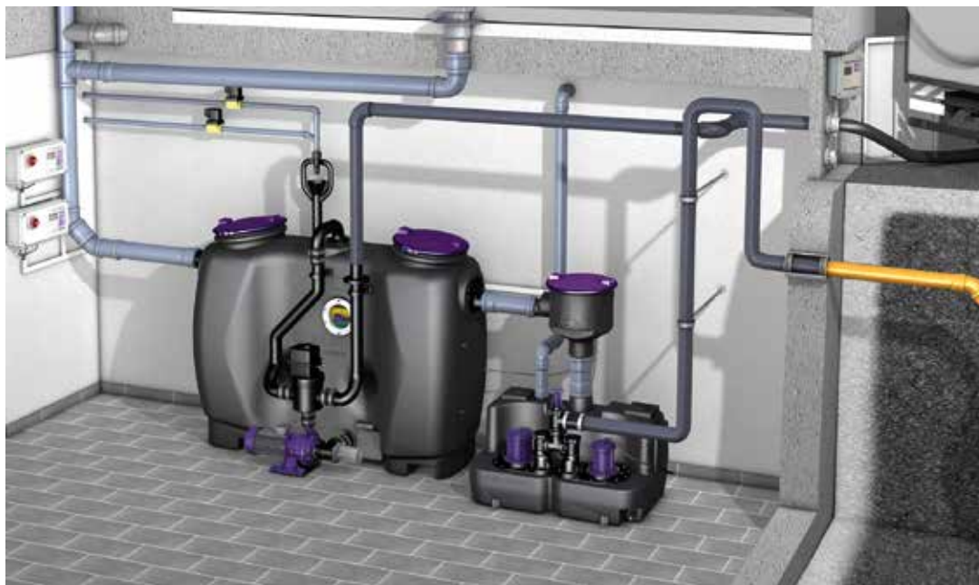
Einbausituation Fettabscheider EasyClean PV