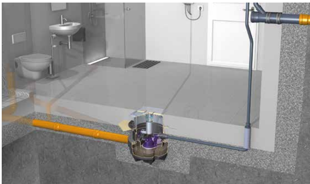
Beispieleinbaubild Hebeanlage Aqualift F Compact Mono