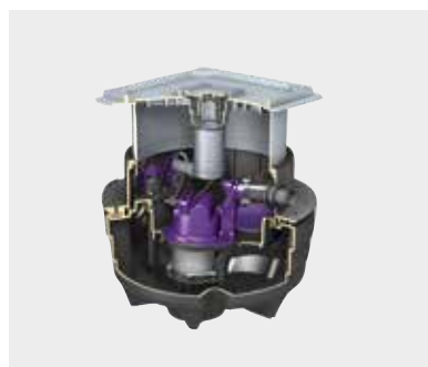
Hebeanlage Aqualift F Compact