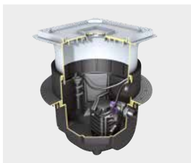
Hebeanlage Aqualift S Tronic

Der Einbau kann platzsparend in die Betonplatte bzw. den Boden erfolgen.