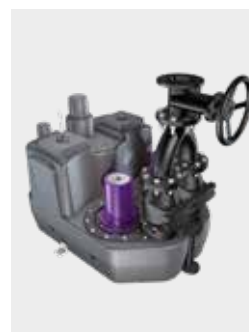
Hebeanlage Aqualift F XL