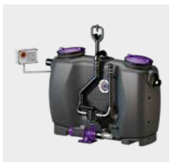
Fettabscheider EasyClean free

Mechanische Klappen der Rückstauverschlüsse verhindern das Eindringen von Nagetieren in das Leitungssystem der Gebäude