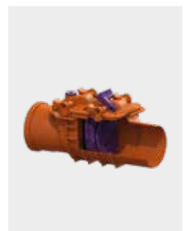
Rückstauverschluss Staufix Basic