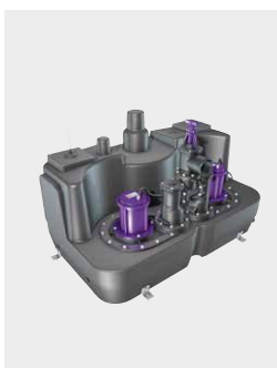
Hebeanlage Aqualift F XL