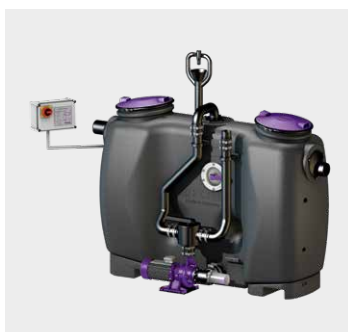
Fettabscheider EasyClean free Auto Mix & Pump

Höchster Hygienestandard durch Edelstahlabläufe Ferrofix