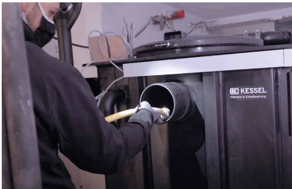
Vor-Ort-Verschweißung des Fettabscheiders mit anschließender Qualitäts- bzw. Dichtheitsprüfung.

Lassen Sie sich beraten: +49 (0) 8456 / 27-460 verkauf@kessel.de