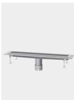
Objektrinne Ferrofix Express