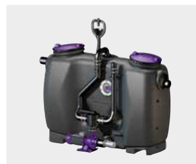
Fettabscheider EasyClean free Auto Mix & Pump

KESSEL liefert mit seinen Partnern das „Rundum-Sorglos-Paket“ mit Beratung, Umsetzung, Betrieb und Wartung.