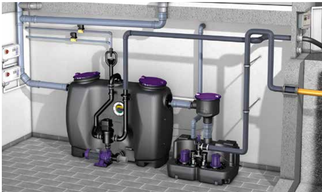
Einbaubeispiel Fettabscheider EasyClean free Auto Mix & Pump