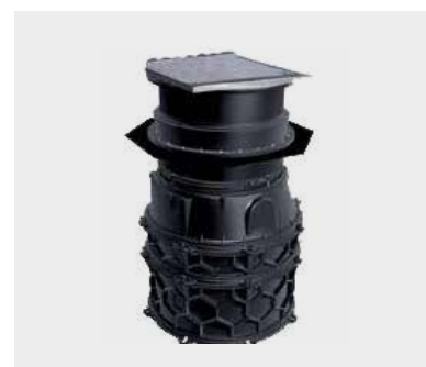
Pumpstation Aqualift F XL