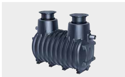
Fettabscheider EasyClean ground

Das geringe Gewicht der KESSEL-Fettabscheider (aus hochbelastbarem, leichtem Polyethylen) ermöglichen einen einfachen Transport und Montage vor Ort.