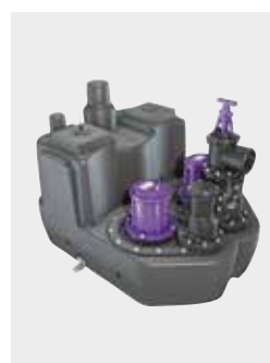
Hebeanlage Aqualift F XL