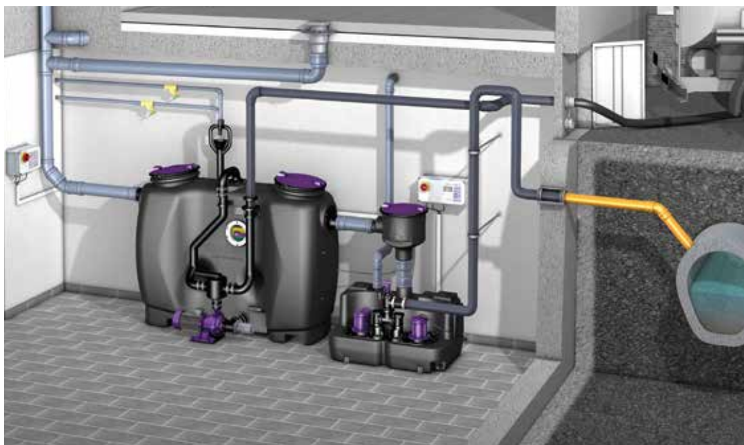
Einbaubeispiel Fettabscheider EasyClean free mit Hebeanlage Aqualift F XL