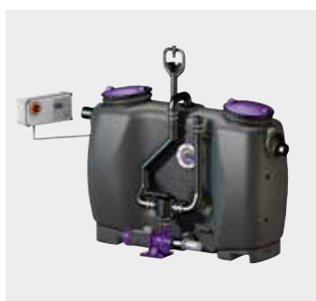
Fettabscheider EasyClean free

Anpassung und Erweiterung des Abscheidersystems ist jederzeit möglich